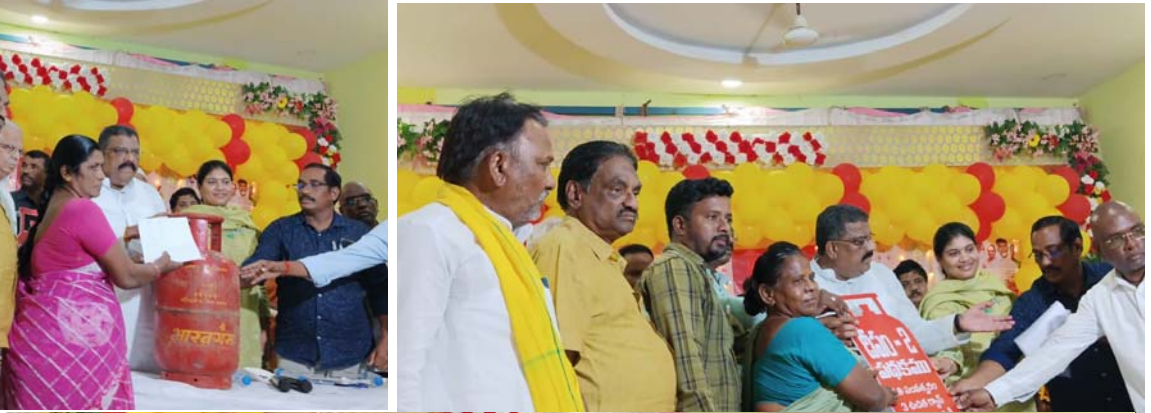
లక్ష్మం అసీ అన్నారు, అందుకని సూపర్ సిక్స్ లో ఇది ఒకటి అసీ, త్వరగా మిగతా డిసెంబర్ నెల లోపల మొదలు అవుతాయి, (మహిళలకు ఉచిత