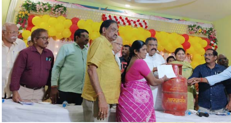
డోన్ ఉత్తేజ ప్రతినిధి