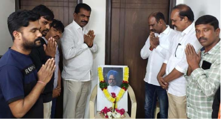
మాజీ ప్రధాని మన్మోహన్ గారి లభించారు ఈ సందర్భంగా ఆయన చిత్రపటానికి పూలమాలలు వేసి నివాళి మాట్లాడుతూ 2004 నుంచి 2014