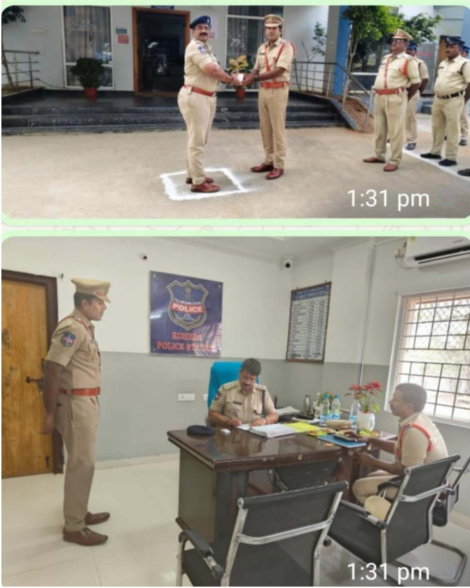
స్థానికంగా మార్కెట్ మాట్లాడాలని ఓపికగా వారి భాద్యులు విని సమస్యలు పరిష్కరించాలని సూచించారు. పోలీస్ స్టేషన్ మనం పని చేసే చుట్టూ పరిసర ప్రాంతాలు ఎప్పుడూ శుభ్రంగా ఉంచుకోవాలని అధికారులకు సిబ్బందికి సూచించారు. వివిధ

పోలీస్ అధికారులు సిబ్బంది ఇన్స్పెక్షన్ వ్యవస్థను మెరుగుపరచుకోవాలిగా మూలము తరచుగా విపిఓ లు సందర్శించాలి. నిజాయితీగా విధులు నిర్వహించడం చాలా ముఖ్యం ప్రజల ధనమాన ప్రాణ రక్షణకు ఎల్లవేళలా అందుబాటులో ఉండి విధులు నిర్వహించాలి ప్రతి దరఖాస్తుదారులతో మర్యాదగా మాట్లాడాలి. పోలీస్ స్టేషన్ చుట్టూ పరిసర ప్రాంతాలు మరియు వివిధ నేరాలలో సీజ్ చేసిన వాహనాలను పరిశీలించారు. పోలీస్ సిబ్బందికి ఏవైనా సమస్యలు ఉన్నాయా అని సిబ్బందిని అడిగి తెలుసుకున్నారు. రిసెప్షన్ వర్కలో ఏదీమీ మేనేజ్మెంట్టు దాటా ఎలా ఎలాంటి చేస్తున్నారు అడిగి తెలుసుకుని ఆన్లైన్లో పరిశీలించారు. ఈ సందర్భంగా మాస్ట్రోబాద్ ఏసిపి వి. సతీష్, మాట్లాడుతూ. అంకిత భావంతో విధులు నిర్వహించాలని సిబ్బందికి సూచించారు, సమరంపూర్వకము కేసుల గురించి మరియు కేసుల పనితీరును పరిశీలించారు. దొంగతనాల నివారణ గురించి పెట్రోలింగ్, బ్లాక్ టోల్స్ సిబ్బంది తరచుగా కేడీలు డీసీలు సస్పెన్డ్ లను పై నిఘా ఉంచాలన్నారు, కేడీలు, డీసీలు, సస్పెన్డ్ లు డౌన్ లో ఉంటే పై మరొకటి తెలిపారు. అధికారోజు ఉదయం సాయంత్రం వినబల్ పోలీసింగ్ విధులు నిర్వహించాలని సూచించారు. ప్రతిరోజు ఎన్ఫోర్స్మెంట్ విధులు నిర్వహించాలని, ఎలాంటి అసాంఘిక కార్యక్రమాలు జరగకుండా ఇన్స్పెక్షన్ వ్యవస్థను మెరుగుపరచుకోని నిఘా ఉంచాలని తెలిపారు. పోలీస్ స్టేషన్ లో ఉన్న రికార్డ్స్ ను షెల్ట్ ను పరిశీలించారు. సాధ్యమైనంత త్వరగా కేసులు డిస్పోజిట్ చేయాలని సూచించారు. పోలీస్ స్టేషన్ ను వచ్చే