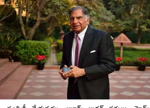
పంపిణీ చేయవచ్చు. బ్రాక్స్ బ్రదర్ షర్మ, హెర్బ్ లైలు, పోల్, డాక్స్, టియోని సూజు వంటి బ్రాండ్లను రతన్ టాటా ధరించేవారు. రతన్ టాటా పెంపుడు జంతువు డిటి గురించి వీలునామాలో ప్రత్యేకంగా ప్రస్తావించారు. జర్నల్ షెఫర్డ్ కోసం ఆయన రూ. 12 లక్షలు కేటాయించారు. ప్రతి త్రైమాసికానికి రూ.30వేల