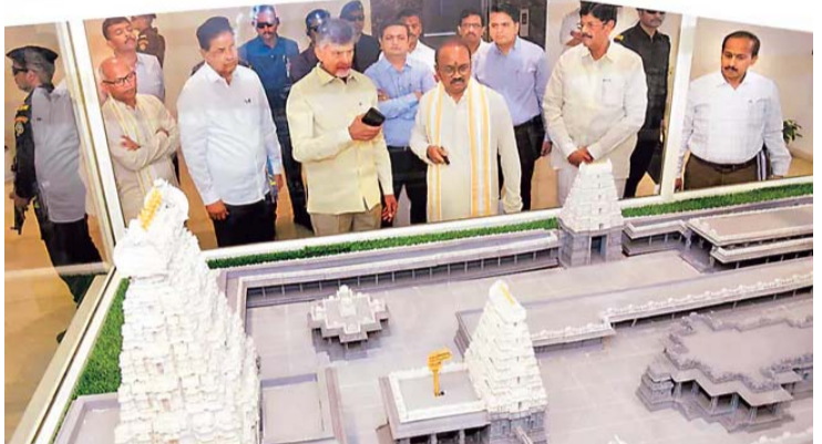
కరీంనగర్, కొడంగల్, నవీ ముంబై, బాంద్రా, ఉలుదుర్చేట్ల, కోయంబతూరుల్లో నిర్మాణంలో ఉన్న శ్రీవారి ఆలయాలపై కూడా సీఎం సమీక్షించారు.

తదితరాలను తెలియజేశారు. 'రథసప్తమి, వైకుంఠ ఏకాదశి వంటి ప్రత్యేక సందర్భాల్లో తితిదే అందించిన సేవలపై భక్తుల నుంచి ఫీట్ బ్యాక్ సర్వే నిర్వహిస్తే అత్యధిక స్థాయిలో సంతృప్తి వ్యక్తమైంది. రథసప్తమి రోజున రద్దీ క్రమబద్ధీకరణ, అన్నప్రసాదం, పరిశుభ్రత, సాంస్కృతిక కార్యక్రమాలు తదితరాల ఏర్పాట్లపై 76 శాతం భక్తులు అర్హతంగా ఉందని, 22 శాతం మంది బాగుందని, ఒక శాతం ఫర్వాలేదని, మరో ఒక శాతం మాత్రం బాగోలేదని తెలిపారు. వైకుంఠ ఏకాదశి రోజున ఏర్పాట్లు అర్హతంగా ఉన్నట్లు 74 శాతం భక్తులు చెప్పారు. మార్చి 9 నుంచి 14 వరకు సాధారణ రోజుల్లో తిరుమలకు వచ్చిన భక్తుల నుంచి ఐవీఆర్ఎస్ విధానంలో అభిప్రాయాలు తెలుసుకోగా.. 61 శాతం మంది భక్తులు తితిదే సేవలు బాగున్నాయని, 27 శాతం ఫర్వాలేదని, 12 శాతం బాగోలేదని అభిప్రాయపడ్డారు' అని అధికారులు వివరించారు. తిరుమలలో సేవలు బాగుంటే ప్రభుత్వానికి మంచిపేరు వస్తుందని సీఎం అన్నారు. గత ప్రభుత్వానికి, ఈ ప్రభుత్వానికి ఇప్పటికీ మార్పు కనిపించిందని.. అయితే వంద శాతం మార్పు ఉంటేనే భక్తుల అంచనాలను అదుకోగలమని పేర్కొన్నారు. అలయం మరింత అభివృద్ధిరాజధాని అమరావతిలోని వెంకటపాలెం వద్ద ఉన్న శ్రీవారి ఆలయాన్ని మరింతగా అభివృద్ధి చేయనున్నట్లు అధికారులు ముఖ్యమంత్రికి వెల్లడించారు. చుట్టూ ప్రాకారంతోపాటు, ఒక రాజగోపురం, మూడు గోపురాలు నిర్మిస్తామని.. వీటికి త్వరలో బెండ్రు పిలవనున్నట్లు చెప్పారు. ఒందిమిట్ట కోదండరామస్వామి ఆలయానికి విస్తరణ పనులు చేసి, తీర్చిదిద్దాలని తెలిపారు.